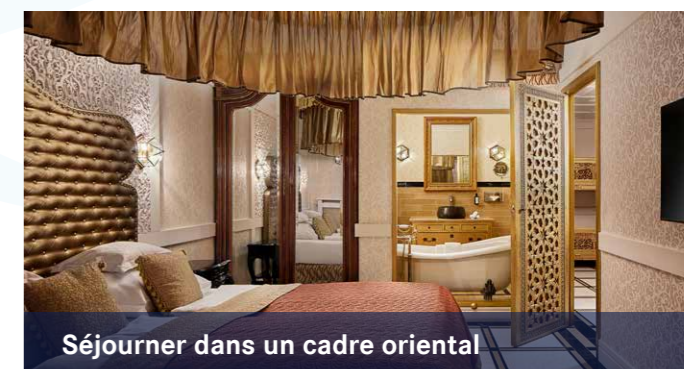
Séjourner dans un cadre oriental

Réservez maintenant aux hôtels d'Europa-Park !