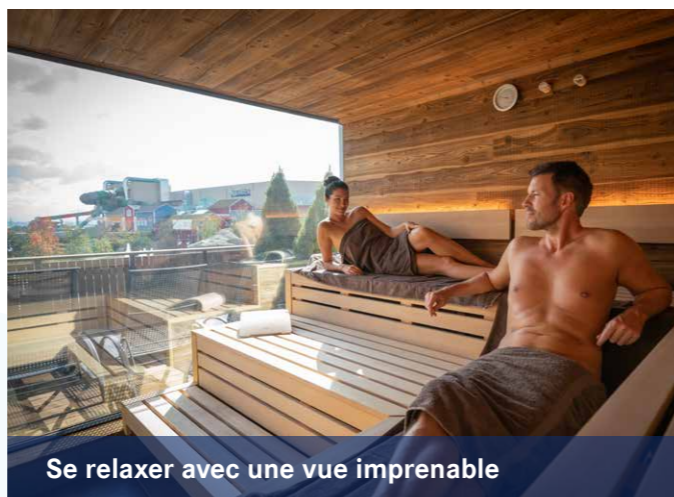
Se relaxer avec une vue imprenable