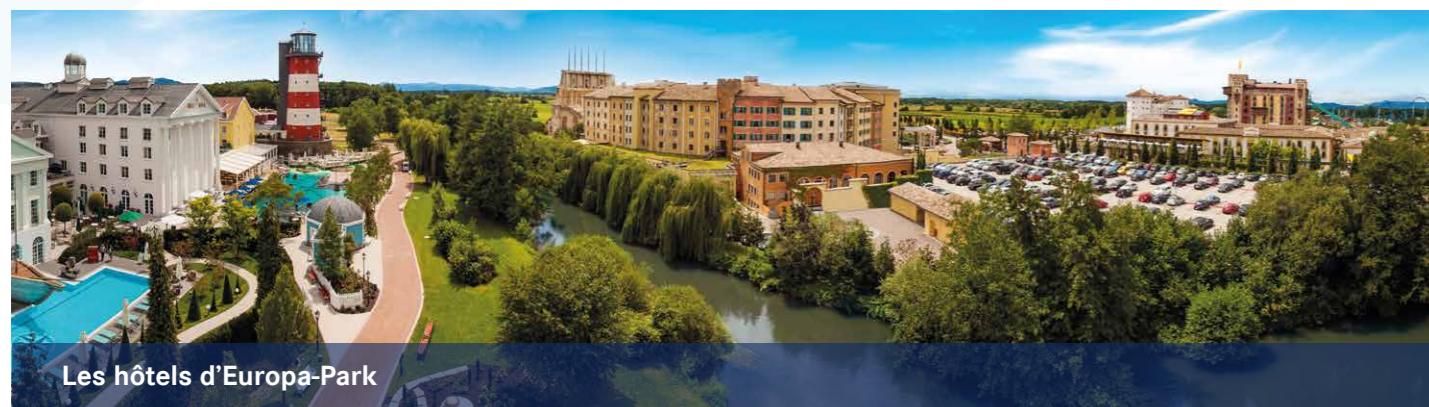
Les hôtels d'Europa-Park

Les six hôtels thématiques 4 étoiles (supérieur) du parc constituent une offre d'hébergement idéale pour les groupes :